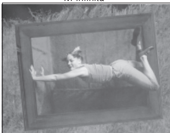
Glanz & Glitter