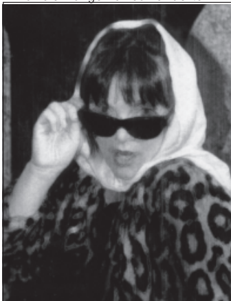
Make Up - Make Down