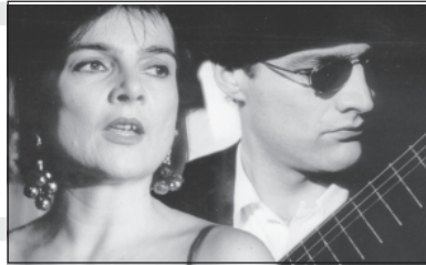
Dorn und Röschen