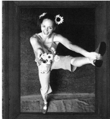
Glanz und Glitter