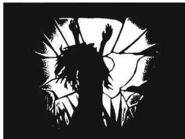
Schattenspiel aus dem Karton